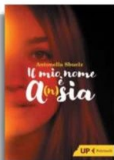
Antonella Sbuclz «Il mio nome è A(n)sia» Feltrinelli pp. 256, €15