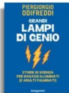
Piergiorgio Odifreddi «Grandi lampi di genio» DeAgostini pp. 240, €19,90 Illustrazioni di Antonio Rossetti