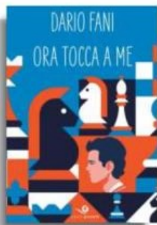
Dario Fani «Ora tocca a me» Giunti pp. 320, €14