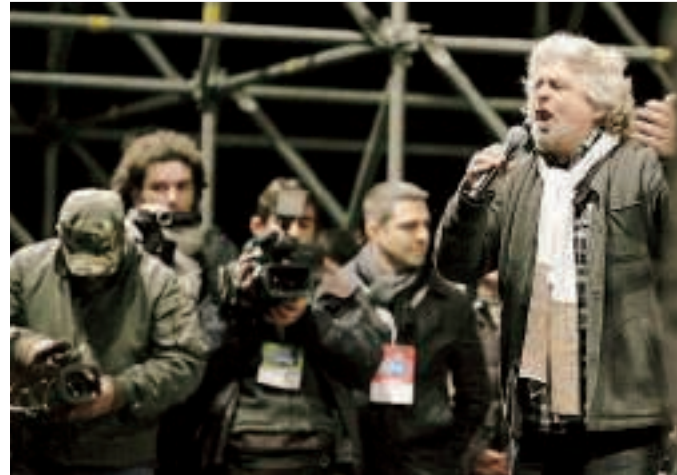
Grillo sul palco di Roma